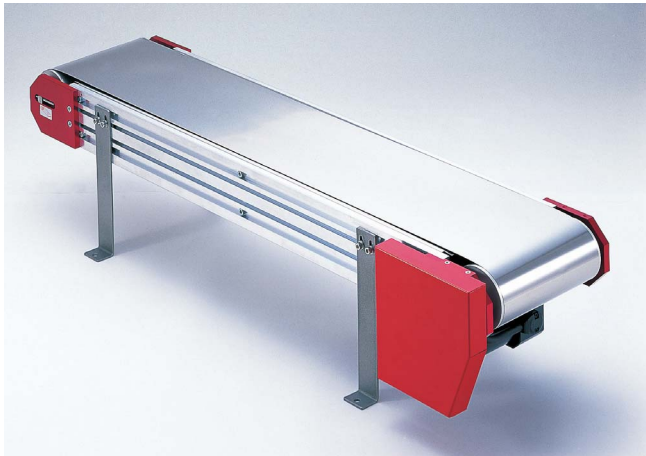
スチールベルトコンベヤ (RSC 020-90)